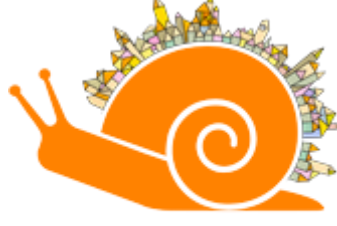
Şekil: Yavaş Şehir Logo

daha iyi bir yaşamın mümkün olduğunu vurgulamaktadır. Sloganın taşıdığı anlam ile birlikte, yerel halk, yerel üreticiler ve yerel yönetimin öneri ve görüşlerine dayalı yerel bir politika geliştirmek, , doğayı korumak, yerel ekonomiyi desteklemek ve toplumun refahını artırmak için birlikte çalışmanın önemi vurgulanmaktadır (Stanowicka vd., 2023:4).